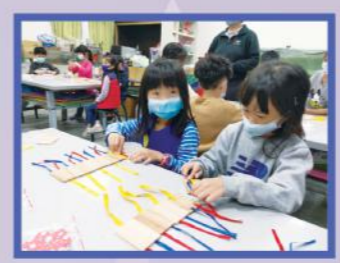
地區低碳推廣中心 https://reurl.cc/GXA5Oy

A：知識建構 地區低碳推廣中心 為深入社區宣導低碳概念，落實民眾居家生活的節能習慣，新北市成立了21個地區低碳推廣中心，於每年6~10月開設各類相關課程。