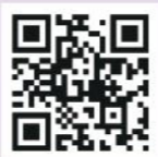
▲第三屆「繪眼識地球」環境教育繪本展覽

環保局也將各組前三名獲獎繪本電子版置於網站供閱讀，請至新北市環保局網站「低碳永續 / 環教」環境教育→環境教育繪本→得獎作品。