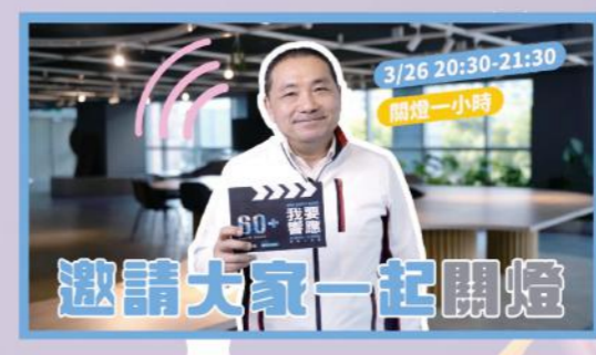
▲2022年關燈一小時活動宣傳影片

自行車響應 關燈一小時活動 由世界自然基金會(WWF)發起，每年3月最後一個週六，串連全世界共同關燈一小時。