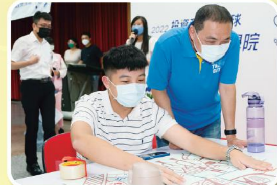
▲學員與侯市長分享營隊成果提案