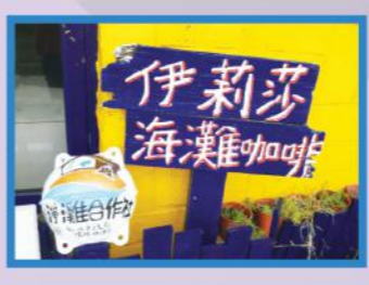
淨灘合作社店家名單 https://reurl.cc/nZDqM6

淨灘合作社 環保局結合沿海店家成立淨灘合作社，家長帶小朋友到海邊遊玩的時候，可以至懸掛「淨灘合作社浮球」的店家借用淨灘工具，一起攜手淨灘清淨海灘！