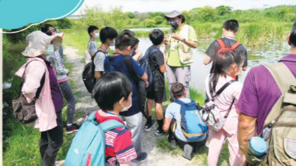
▲新海三期人工濕地生態導覽

2018年，15歲的瑞典學生格蕾塔·童貝里（Greta Thunberg）每週五到瑞典議會外抗議大人們未重視氣候變遷議題。隔